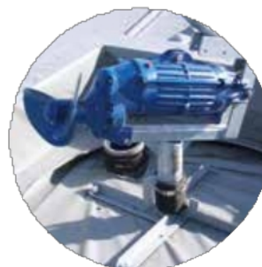
Mešalnik na mešalnem temelju.